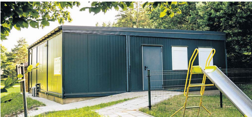
FOT. LOKALNA GRUPA DZIAŁANIA

Beneficjent: Gmina Rutka-Tartak. Numer operacji: 5/II/EFRR/2018. Tytuł operacji: „Rozwój ogólnodostępnej infrastruktury turystycznej w Gminie Rutka - Tartak poprzez stworzenie miejsc obsługi rowerzystów (MOR) w miejscowościach Roweles oraz Baranowo”. Wysokość przyznanego wsparcia: 68 646,54 zł. W ramach operacji zagospodarowano teren przy wieżach widokowych w miejscowościach Roweles oraz Baranowo. Dzięki wsparciu LGD sfinansowano dwa Miejsca Obsługi Rowerzystów, w skład których wchodzi: utwardzony plac, wiaty chroniące przed niekorzystną aurą ze stołami i ławami do odpoczynku, stojaki na rowery oraz tablice informacyjne dla turystów. Jest to kolejne, przyjazne wielbicielom turystyki rowerowej, miejsce na mapie Suwalszczyzny.