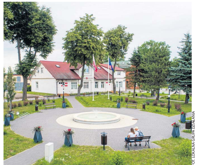
FOT. LOKALNA GRUPA DZIAŁANIA

W ramach operacji zagospodarowano przestrzeń publiczną przy Placu Kościuszki w Raczkach, poprzez przebudowę chodników, dróg wewnętrznych, parkingu, oświetlenia ulicznego, budowę instalacji wodociągowej i kanalizacji deszczowej. Dzięki tej inwestycji oraz kolejnym, które realizowane zostały przez samorząd Gminy Raczk, Plac Kościuszki stał się prawdziwą wizytówką miejscowości.